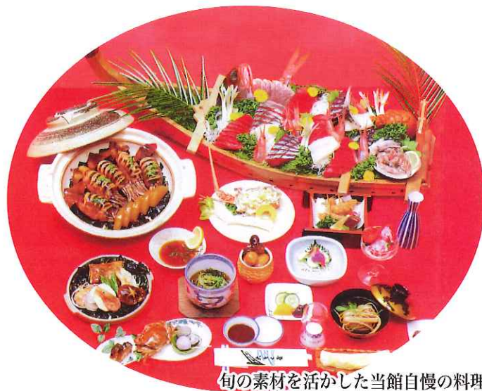
旬の素材を活かした当館自慢の料理