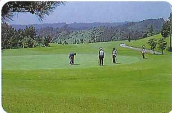
ゴルフ場(浜岡・相良)