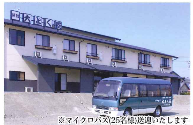
※マイクロバス(25名様)送迎いたします