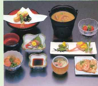
相良懐石 2,500円より(日・祭日要予約)

素朴な海の町、相良。四季おりおり、彩り豊かな海の幸が自慢です。"万寿田"の心意気は新鮮さと素材のよさをそのまま生かした活魚料理、磯料理…。頬をなでる潮風の香りが、旅ごころをいっそう盛りあげることでしょう。