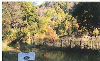
石雲院 せきうんいん